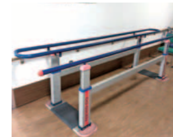
リハビリルーム(器具)