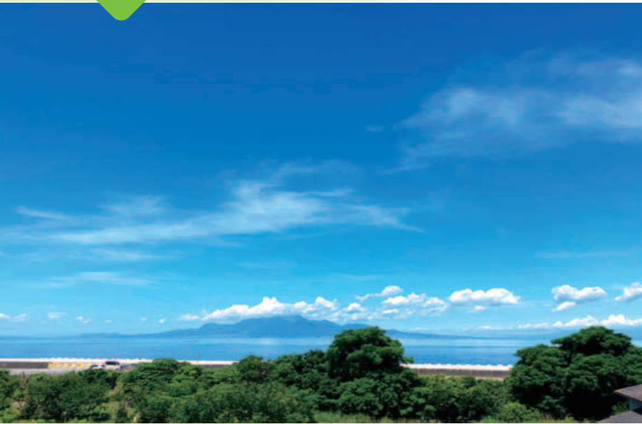
海側個室からの眺望(一例)